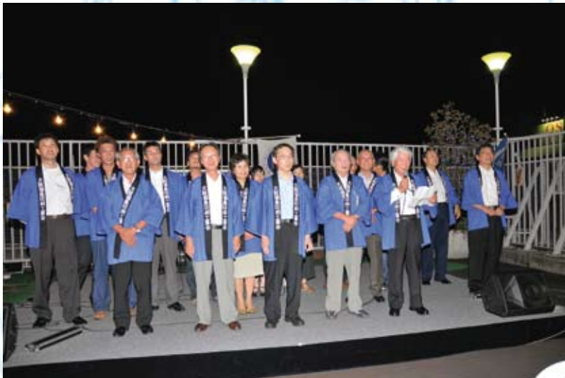
ビアパーティ特別委員会のメンバー

出となりました。 最後に恒例の抽選会が行われ、 午後9時無事に終了出来ました。 福印工最大規模のイベント でありながら低予算で、協賛 会社様、役員、設営スタッフ、 会員の皆様のご協力なくして は実現不可能であることは言 うまでもありません。皆さん の協力と努力、楽しいビアパー ティにしようという思いが1 つになるからこそあの時の ビールは格別おいしいのだと 思っています。本当に有難う ございました。