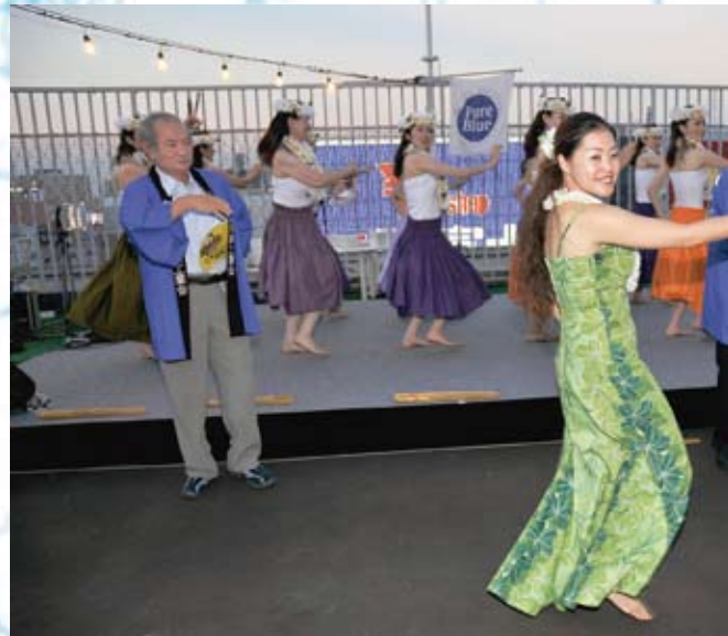
役員も場を盛り上げるために奮闘のフラダンス?....に挑戦