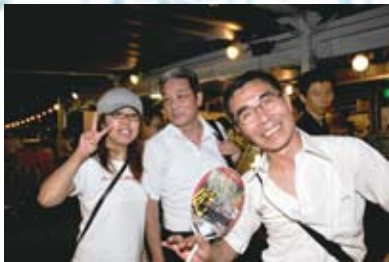
ほろ酔い気分の参加者