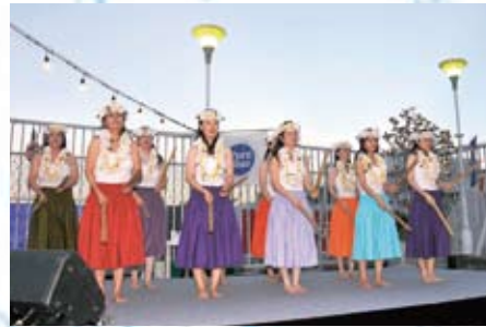
ALOHA HULA O KA LANI の息のあったフラダンスショー