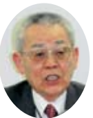
会計監査報告される 大塚会計監査