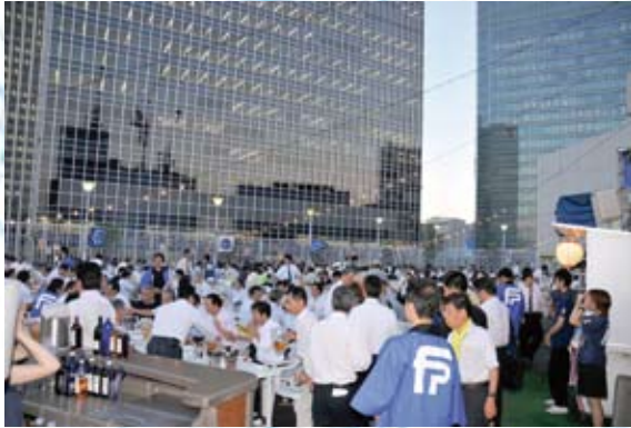
沢山の参加者で会場は熱気にあふれる。