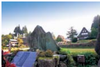
世界遺産 相倉合掌造り集落の入口