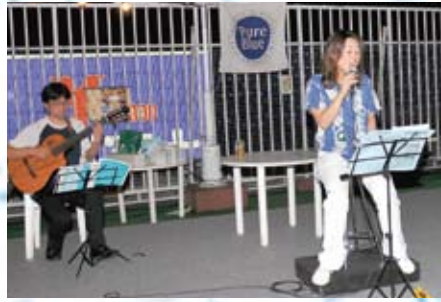
KIKIのライブステージ