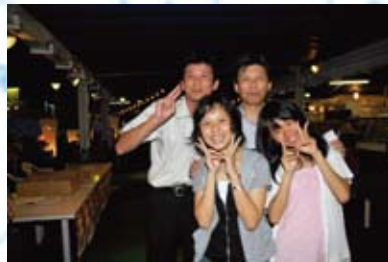
お子さんも大いに楽しんだ