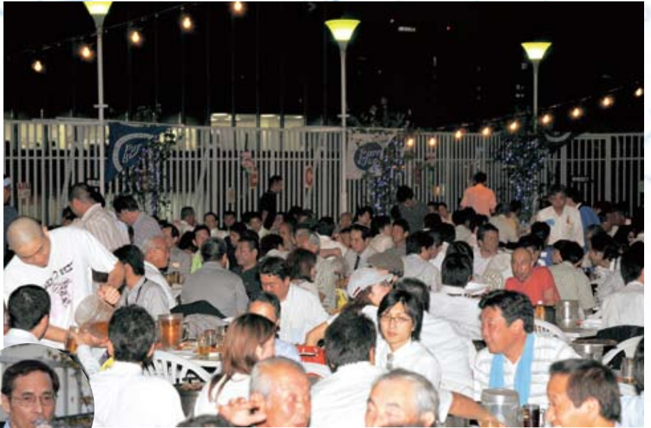
今回もおおいに盛り上がるビアパーティの会場