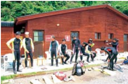
へどへどになった体験ダイビング

夜は会員さんのご協力により、エクスピア白浜に泊まり、白浜のおいしい食事に舌づつみをつけながら、皆の親交を深めました。二日目は串本に移動して、串本ダイビングパークで体験ダイビングを経験しました。初体験の人でも気軽に楽しめるということでしたが、昨日の疲れが残っていたせいか、皆さんけっこう悪戦苦闘していたようです。しかし、経験豊富なインストラクターに支えられ、日本屈指の美しいサンゴの海を潜ることができ、いい思い出ができました。水着とタオルさえ用意すればOKなので、興味ある方はぜひ一度体験してみてください。