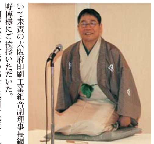
インターネット落語家・桂文喬師匠