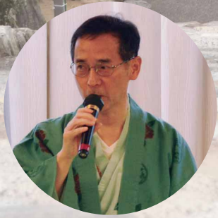
松本会長のご挨拶